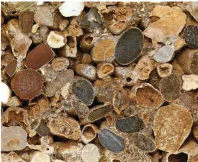
Abb. 2: Nagelfluh geschliffen (aus: Walter Schumann, Der neue BLV Steine- und Mineralienführer , 3. Aufl. München 1991, S. 271)

bleibt. 16 Nicht so ausdrücklich erklärt ist eine Form-Analogie zwischen teils zerbrochenen Erkennungsmarken und dem Oberflächenmuster eines Monoliths aus Nagelfluh, der in der „Cella“ „aus dem Boden wachsen“ soll (obgleich nicht der märkische Sand, sondern das Voralpengebiet für seine Herkunft genannt worden ist). Die Gerölle in diesem Konglomerat bilden an halbierenden Schnittflächen ein Muster aus elliptischen Flecken, ähnlich dem Umriss der Erkennungsmarken. Kein anderes Gestein hätte eine solche Formanalogie ermöglicht. 17 Nagelfluh gehörte zum Material der zerstörten Buddha-Statuen von Bamian in Afghanistan, dem Aktionsgebiet deutscher Gebirgsjäger aus Mittenwald. 18 Eine Anspielung auf Auslandseinsätze war möglicherweise auch gemeint, wenn mit dem drittplatzierten Entwurf eine Zeile aus Rilkes Gedicht „Der Fahnenträger“ als Inschrift vorgeschlagen wurde, da dieses ein Derivat der „Weise von Liebe und Tod des Cornets Christoph Rilke“ sei.