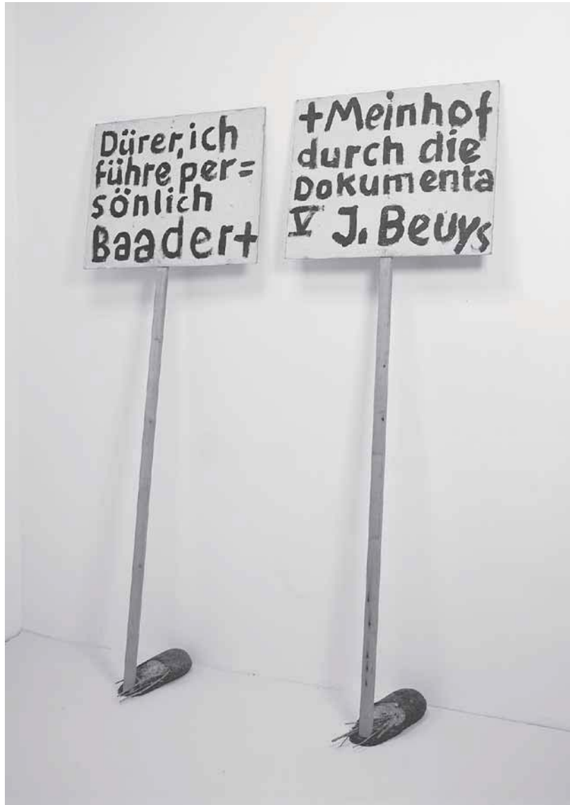
Abb. 1: Joseph Beuys, Installation »Dürer, ich führe persönlich Baader + Meinhof durch die Documenta V«, 1972